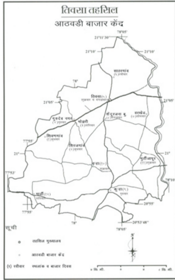
(नकाशा क्र. 1)

तिवसा तहसिल मधील आठवडी बाजार दर सात दिवसांनी म्हणजेच आठवड्यातून एक दिवस भरतो. केवळ तिवसा येथे आठवड्यातून दोन दिवस आठवडी बाजार भरतो. येथिल बाजारांची संख्या सर्वच दिवसाला सारखी नाही. तिवसा तहसिल मधील एकूण 11 बाजार केंद्रांवर आठवड्याला एक व आणि तिवसा या बाजार केंद्रांवर आठवड्याला दोन वेळा या प्रकारे एकूण 13 बाजार दर आठवड्याला भरतात.(नकाशा क्र. 1) म्हणजेच तहसिलमध्ये दरदिवसी सरासरी दोन (1.82) ठिकाणी बाजार भरतात. (सारणी क्र. 1)