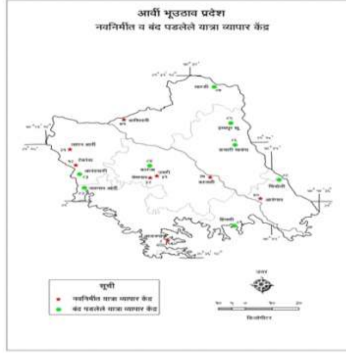
सारणी क्र 2 बंद पडलेली यात्रा व्यापार केंद्र