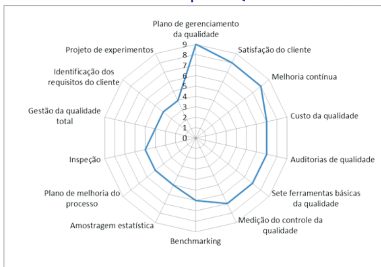
Ilustração 4 – Fatores Determinantes para a Qualidade em Gestão de Projetos